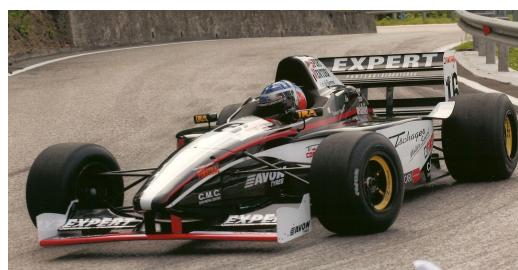
Formel 3000 LOLA/Cosworth ab Euro 1.390

Für Firmen die das etwas andere Event, Geschenk oder Prämie suchen, stellen wir gerne ein passendes Programm zusammen.