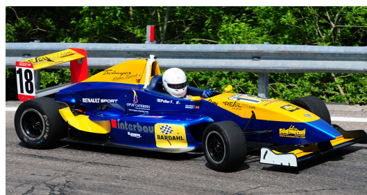
FORMEL Renault 2000 ab Euro 660